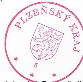
Mgr. Zdeněk Honz člen Rady Plzeňského kraje pro oblast sociálních věcí