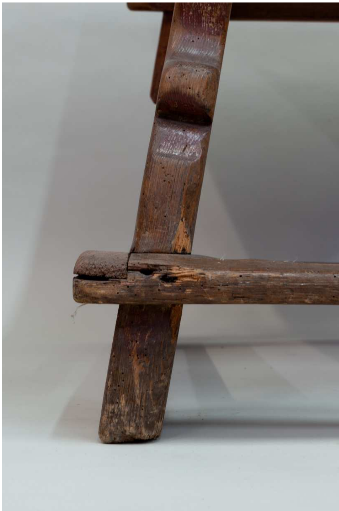
Stav před restaurováním - detail poškození trnože