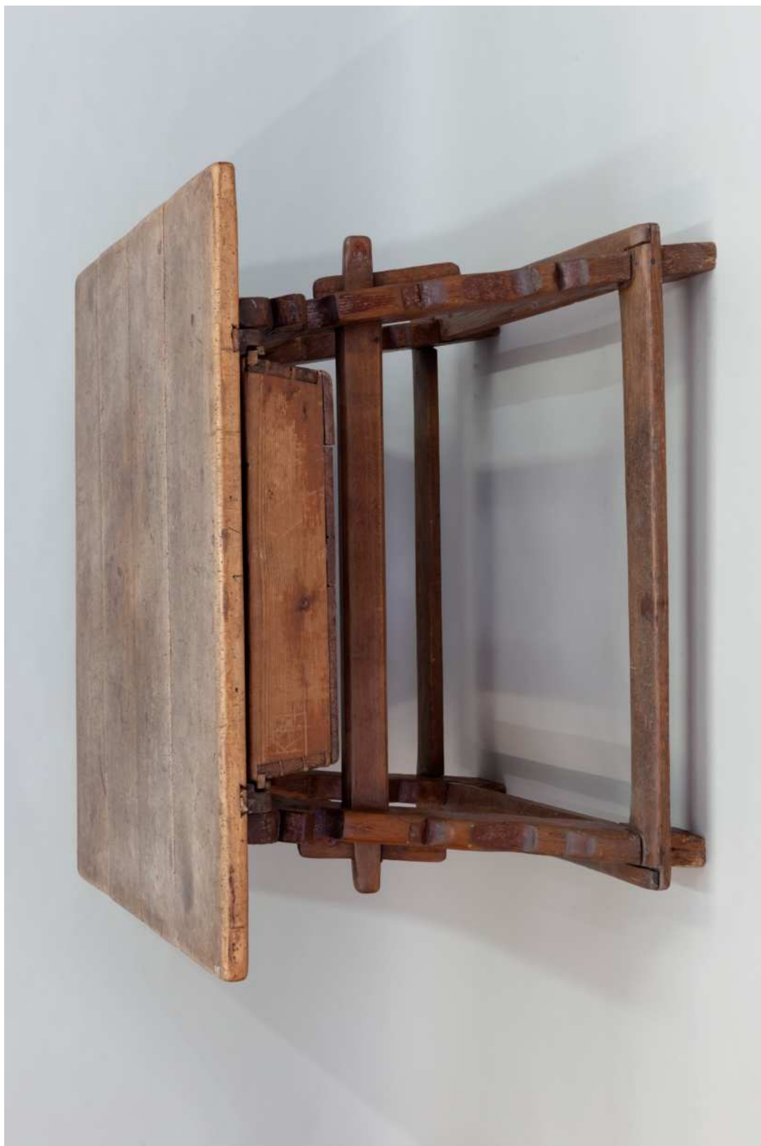
Stav před restaurováním - celkový pohled