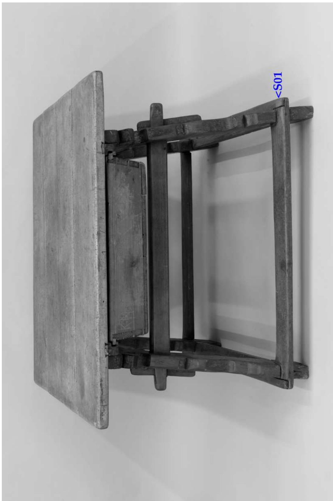
Umístění zkoušky snímání prachových depositů a ztmavlých laků