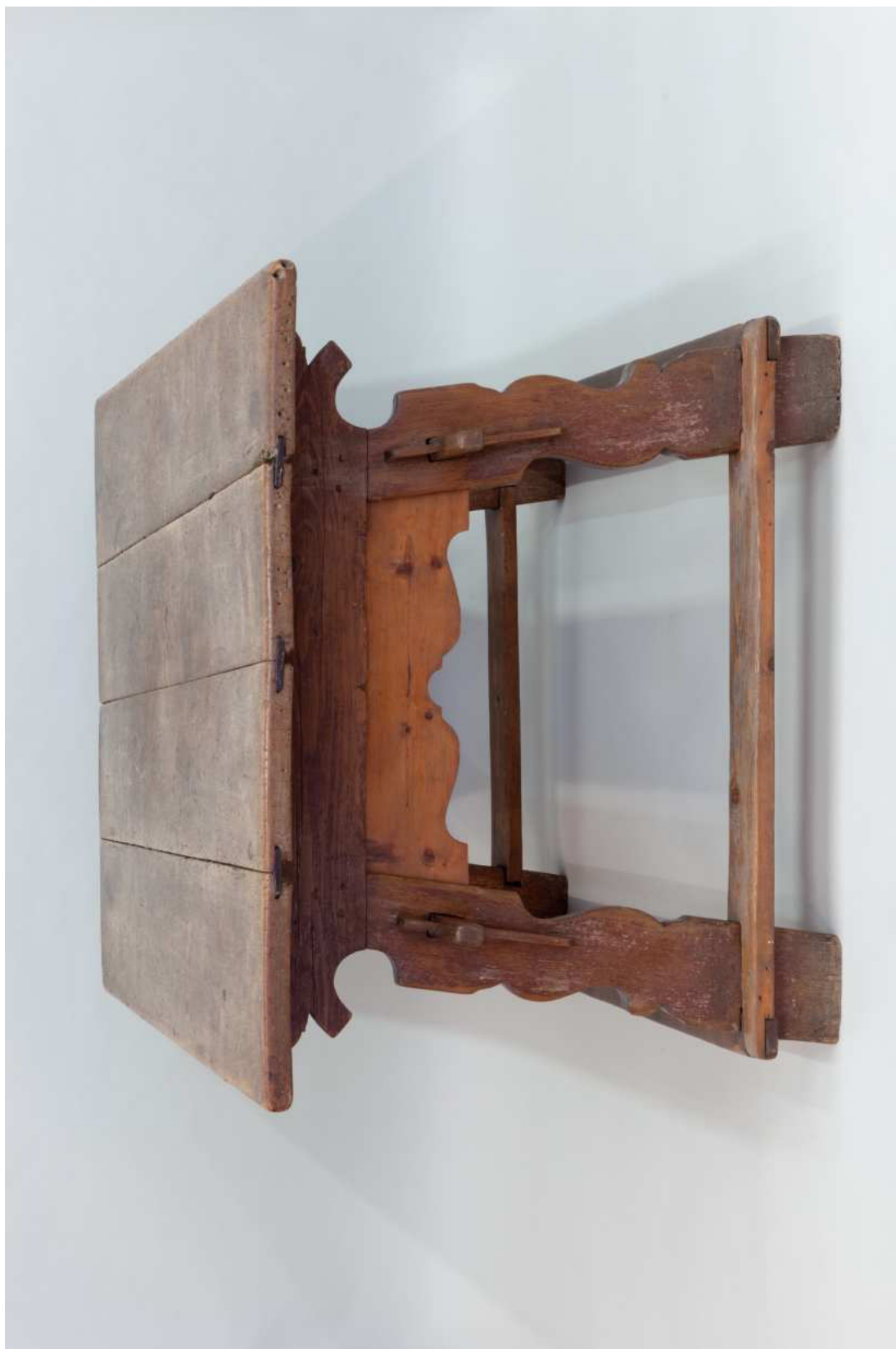
Stav před restaurováním - celkový pohled