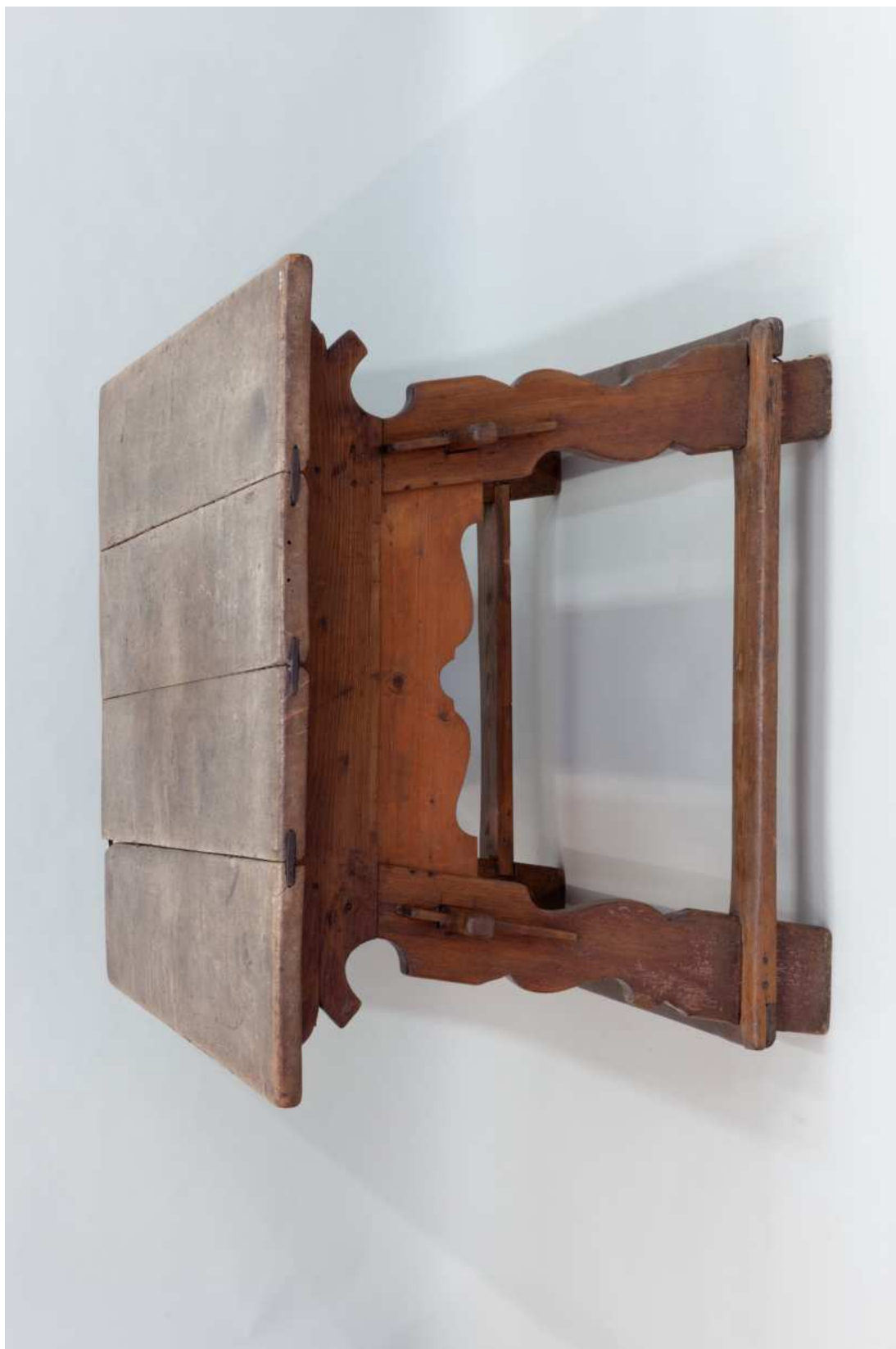
Stav před restaurováním - celkový pohled