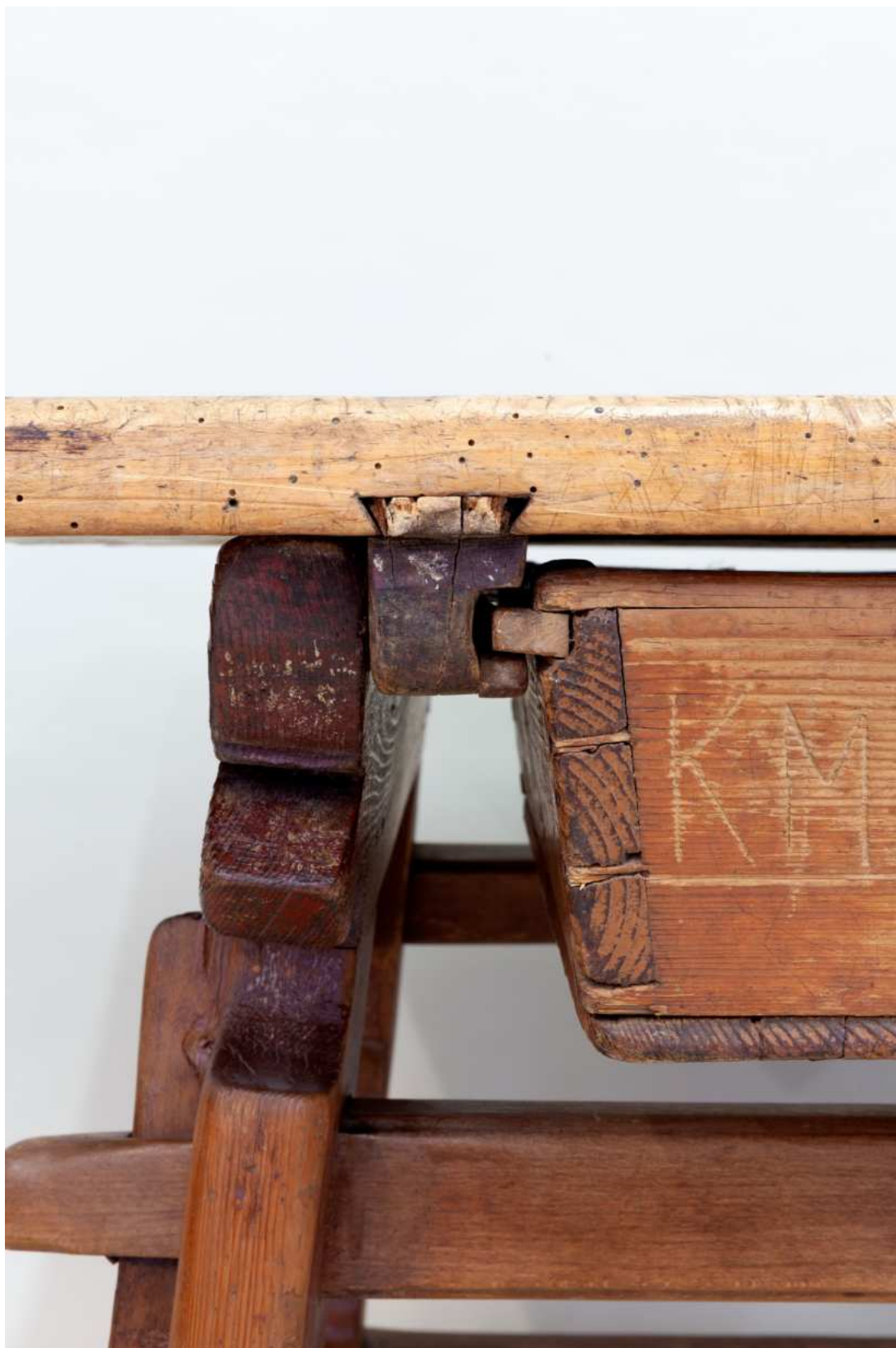
Stav před restaurováním - detail poškození svlaku /pojezdu