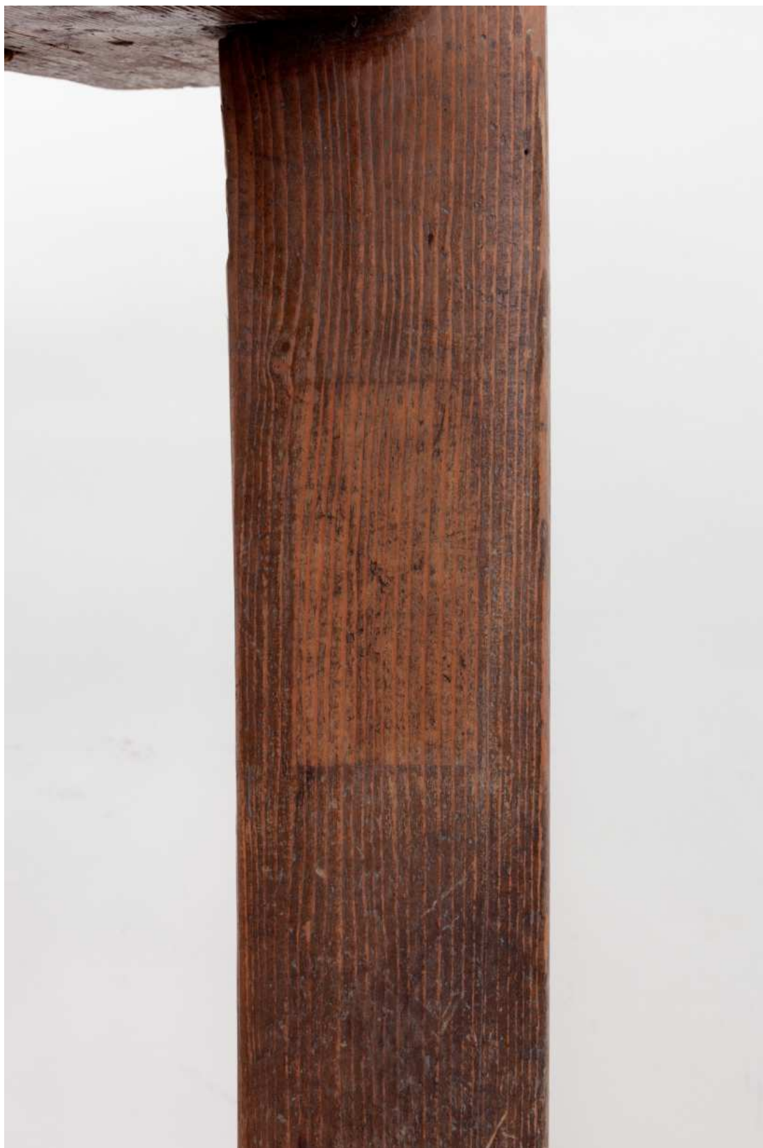
S01 - zkouška snímání prachových depositů a ztmavlých laků - trnož