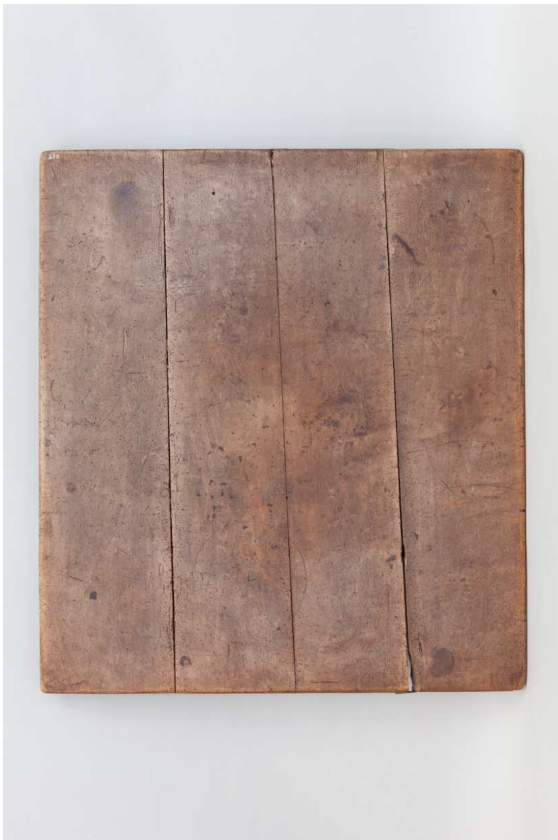
Stav před restaurováním - celkový pohled