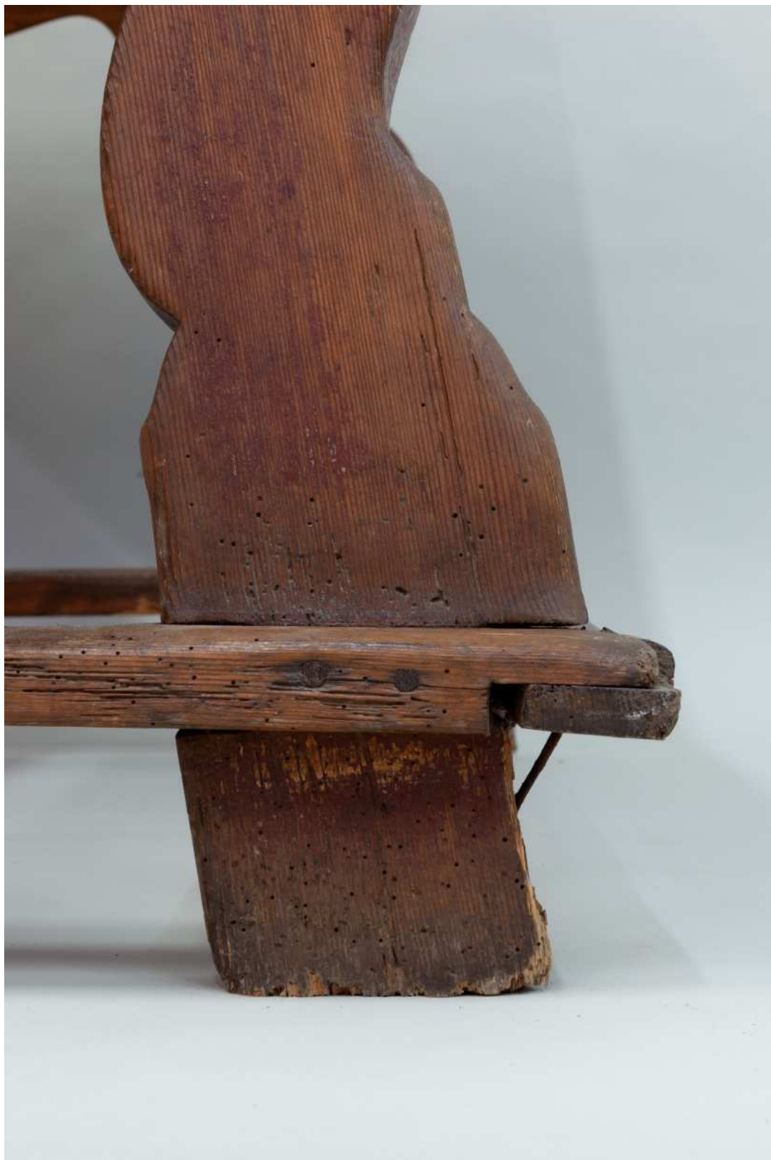
Stav před restaurováním - detail poškození nohy