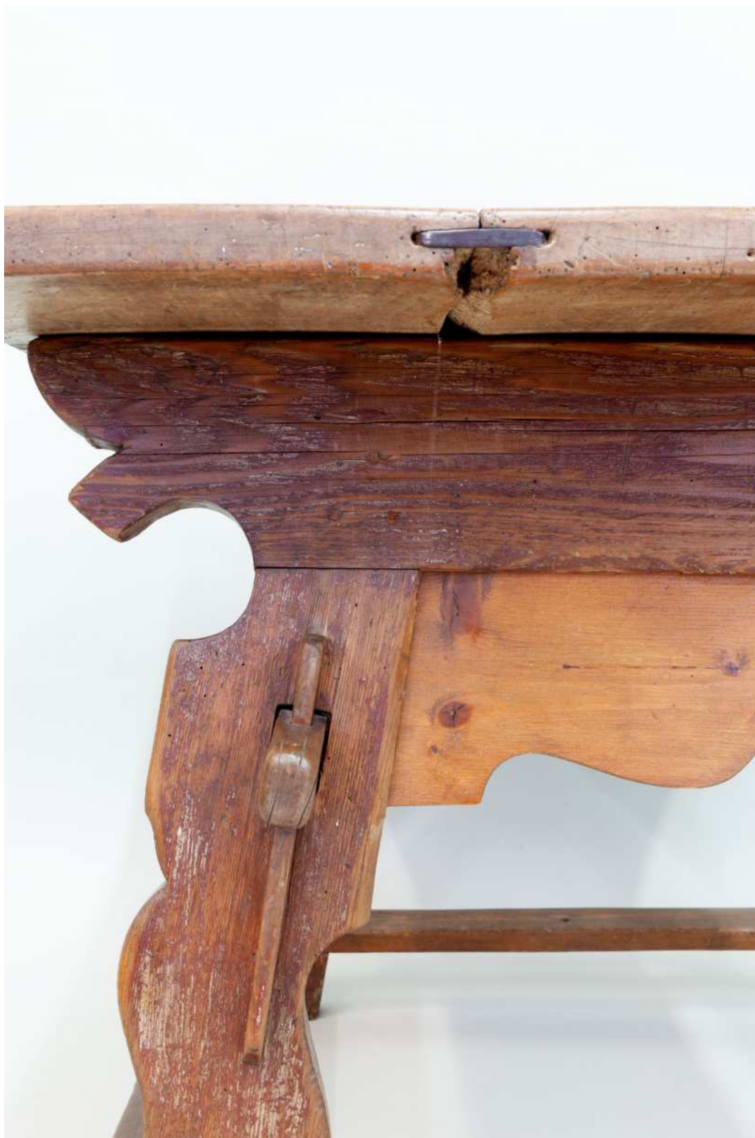
Stav před restaurováním - detail podstolí