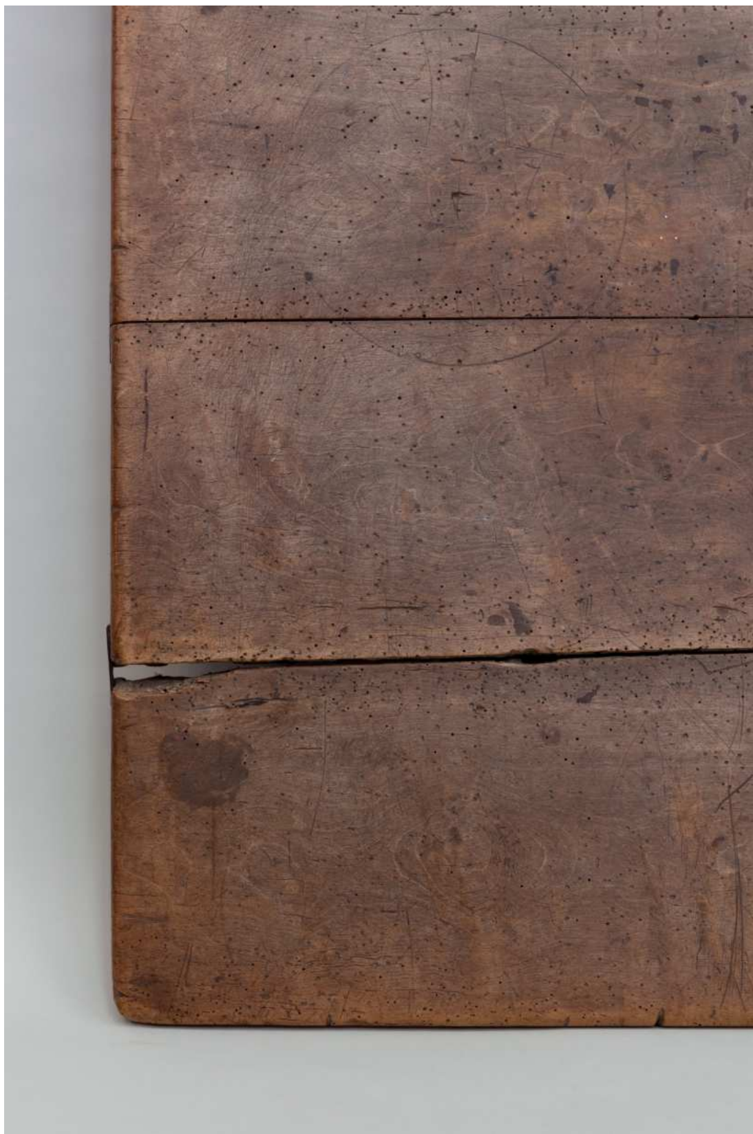
Stav před restaurováním - stolní deska, detail poškození