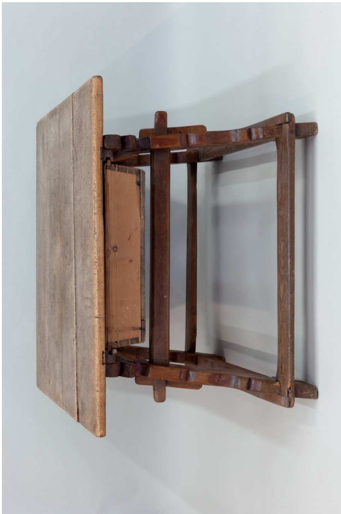
Stav před restaurováním - celkový pohled