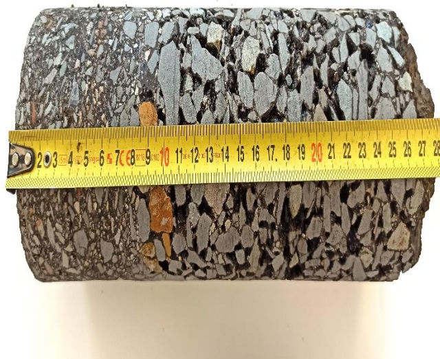
Jádrový vývrt č. 2