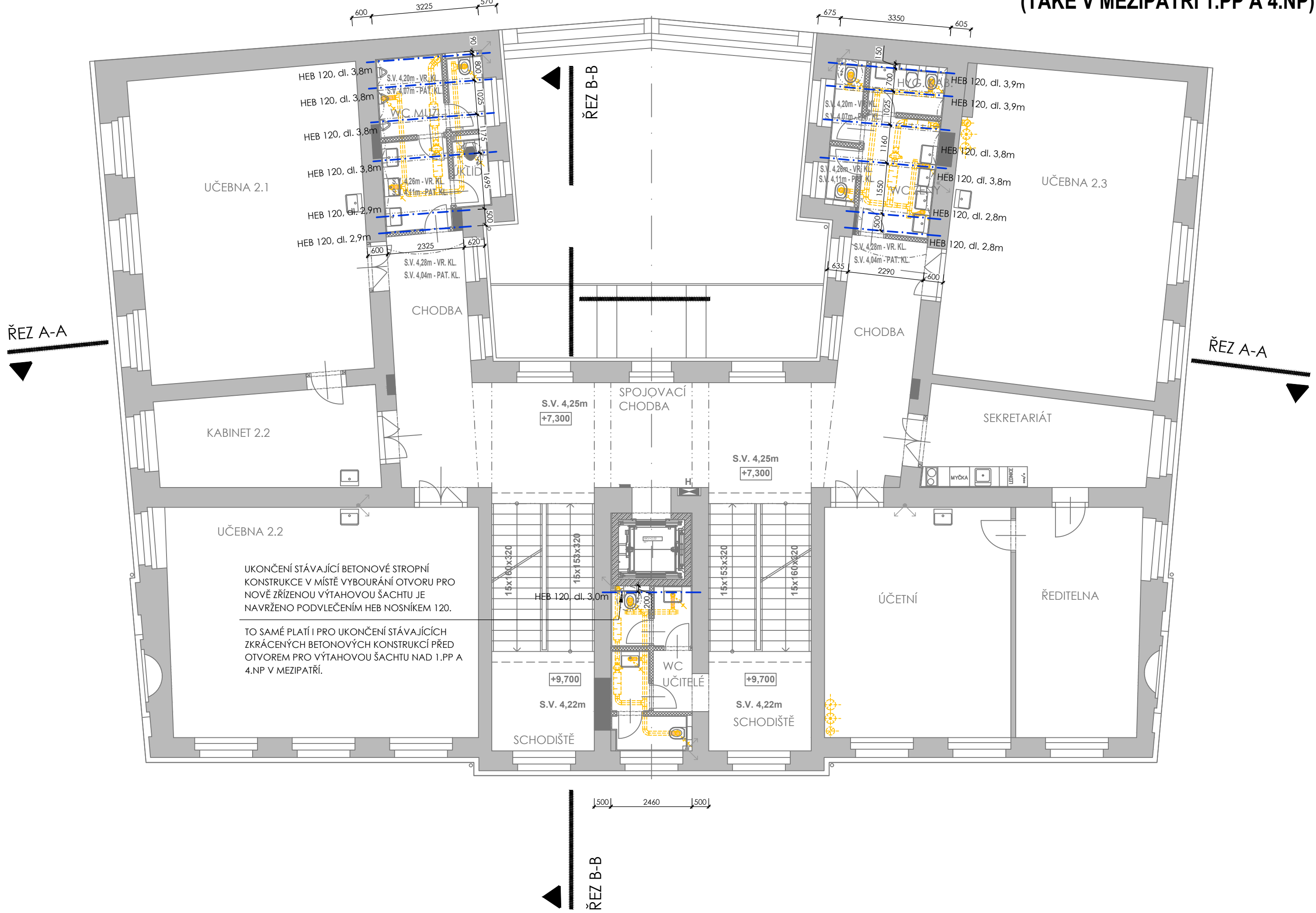
PŮDORYS 2.NP - PODVLEČENÍ OCELOVÝMI NOSNÍKY STÁVAJÍCÍ KLENEBNOU KONSTRUKCI POD SOCIÁLNÍM ZÁZEMÍM 3.NP PODVLEČENÍ OCELOVÝM NOSNÍKEM STÁVAJÍCÍ STROPNÍ KONSTRUKCI PŘED VÝTAHOVOU ŠACHTOU V MEZIPATŘÍ 2.NP (TAKÉ V MEZIPATŘÍ 1.PP A 4.NP)