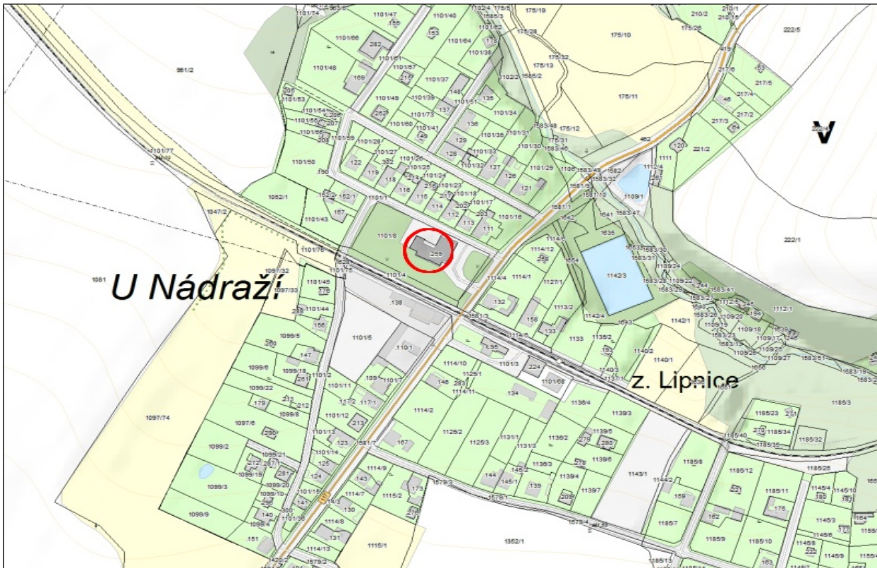
Lipnice čp. 152

Poříčí, podpořené dotací Plzeňského kraje, do 30.11.2020), souřadnice 49.6454253N, 13.6090361E