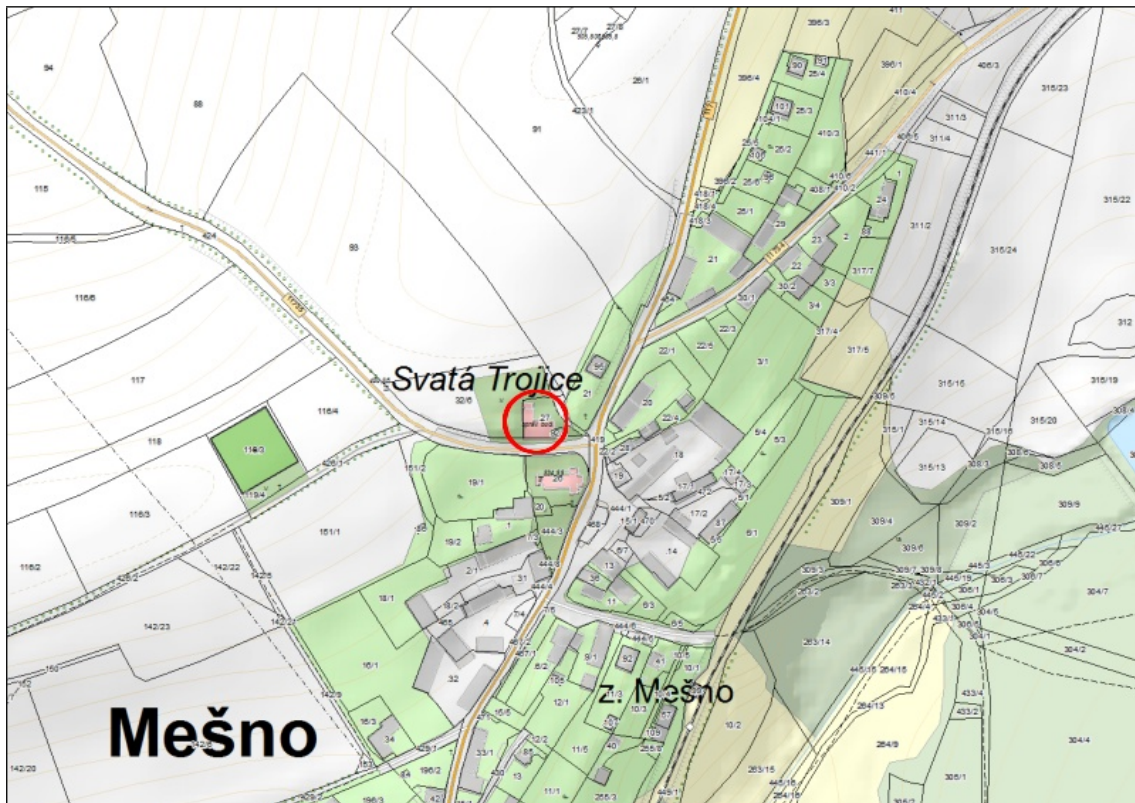
Mešno čp. 29