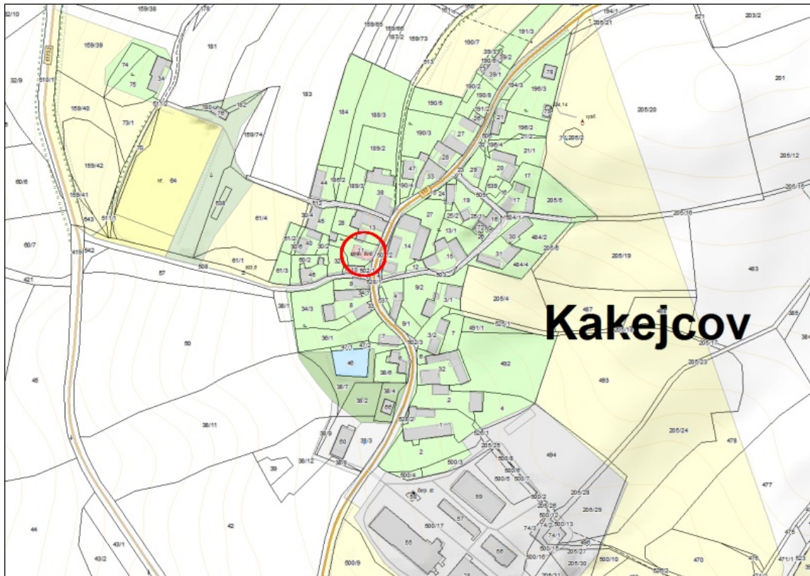
Kakejcov čp. 29