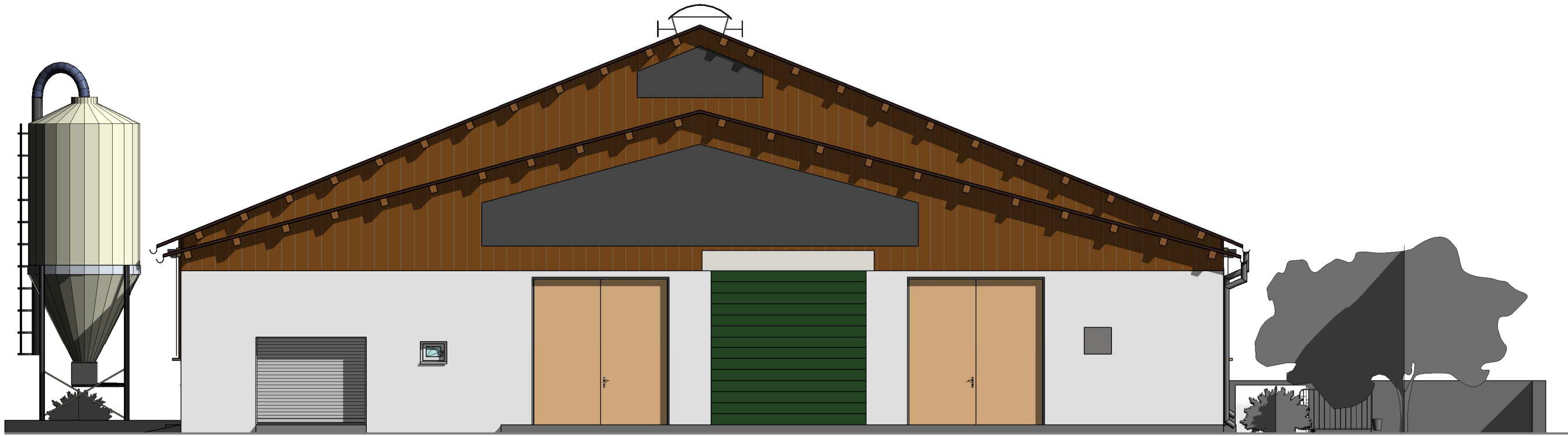
2 Pohled č.2 1 : 100