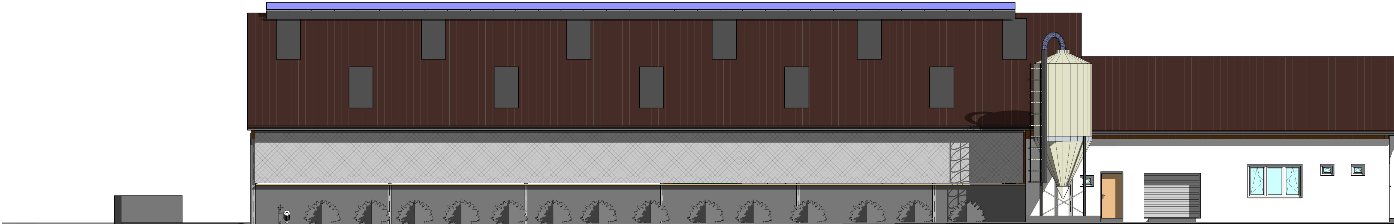
1 Pohled č.1 1 : 100