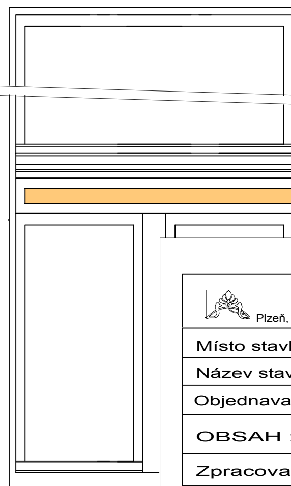
schéma provedení vlysů na vnějším okenním rámu poznámka: