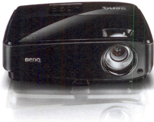
Projektor BenQ MW523