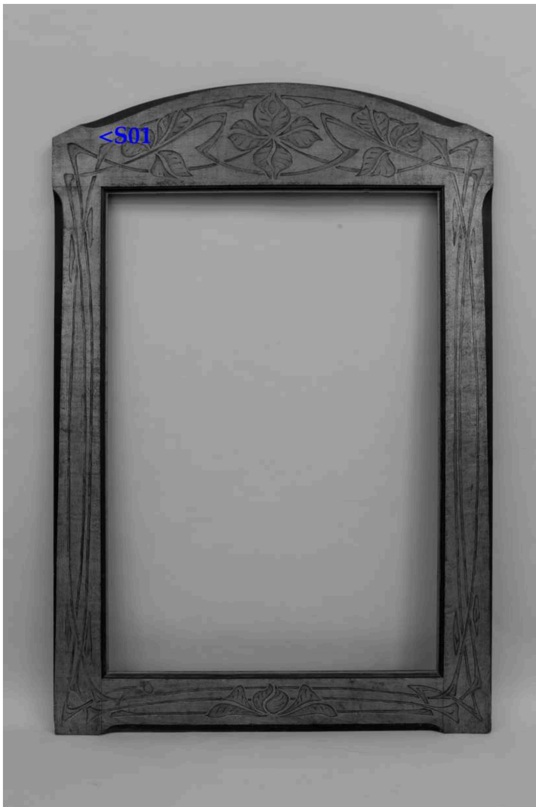
Umístění zkouky snímání ztmavlých laků a prachových depositů