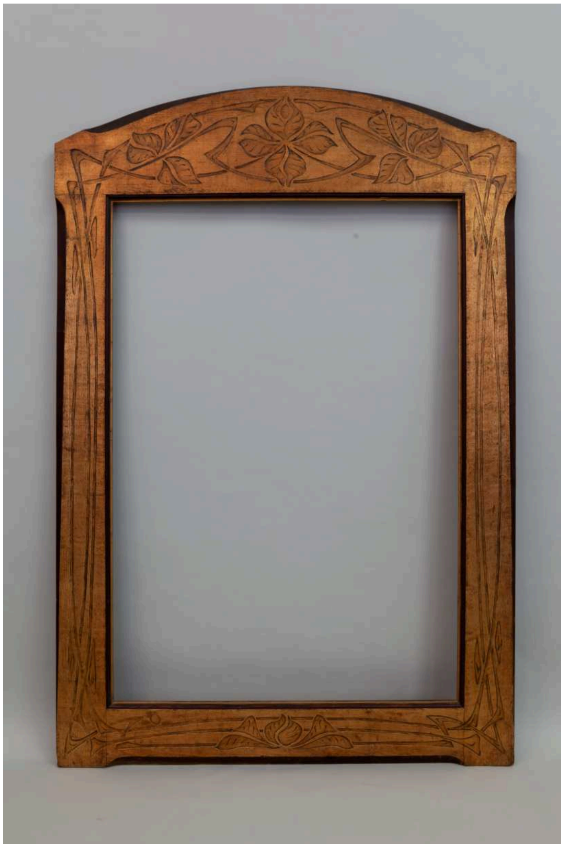
Stav před restaurováním - celkový pohled