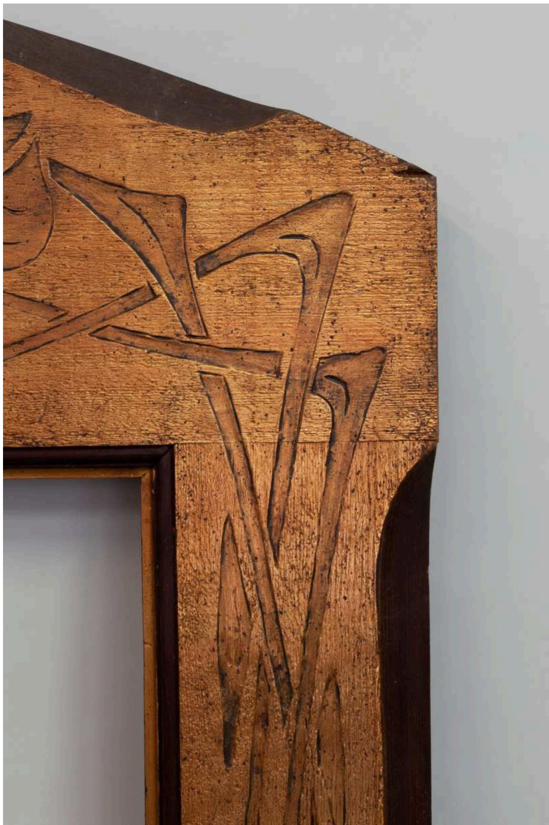
Stav před restaurováním - pravý roh