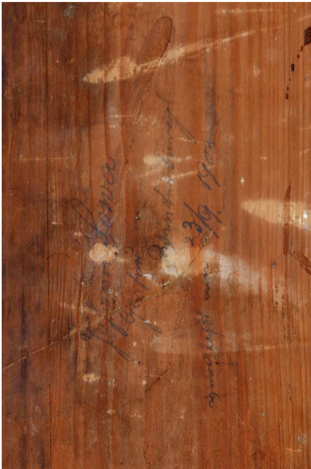
Stav před restaurováním - zadní strana (nápis tužkou)