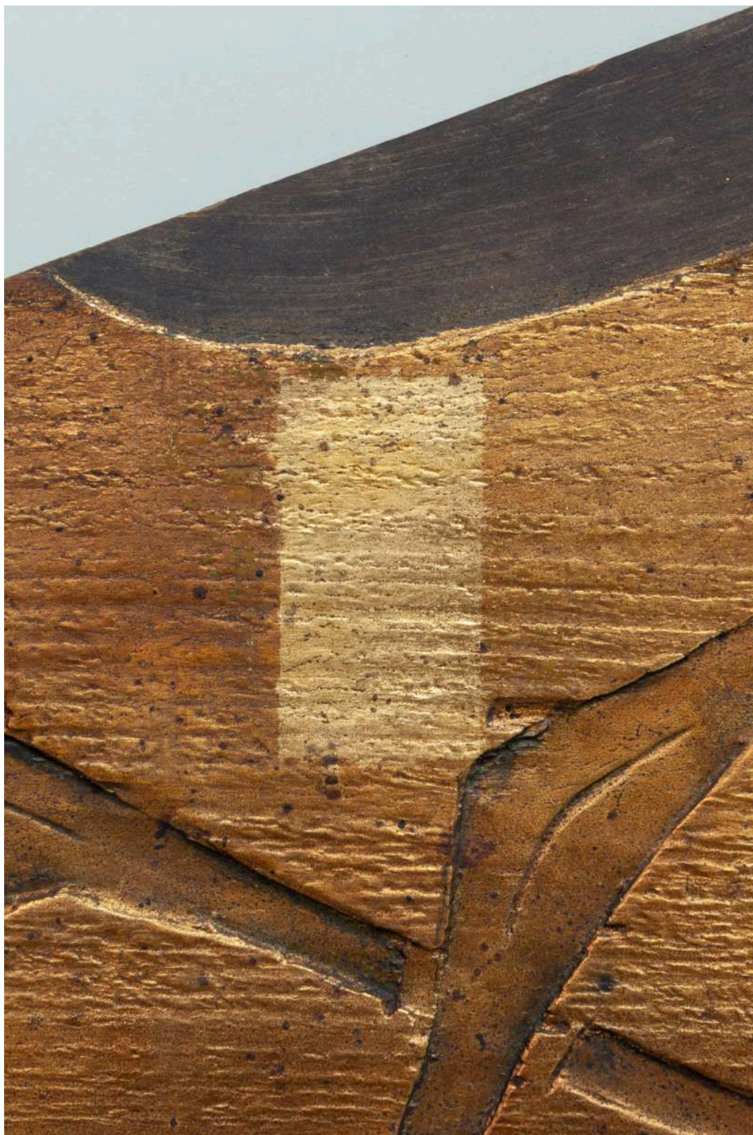
S01 - zkouška snímání ztmavlých laků a prach. depositů - levý horní roh